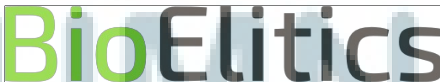
Gambar 2.2 Logo BioElitics

PT Elitics Teknologi Nusantara menghasilkan produk berupa search engine . Produk yang dikembangkan diberi nama BioElitics dan SocioElitics.