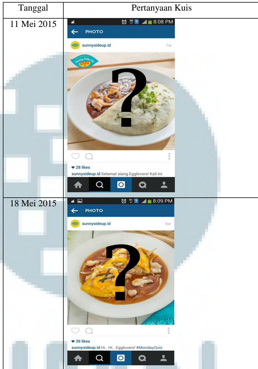
TABEL 3.3.1.1.2 Tabel Kuis Instagram