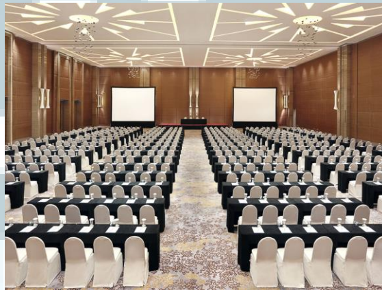
Gambar 2.1.1.2 Grand Ballroom