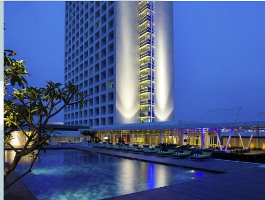
Gambar 2.1.1.2 Pool