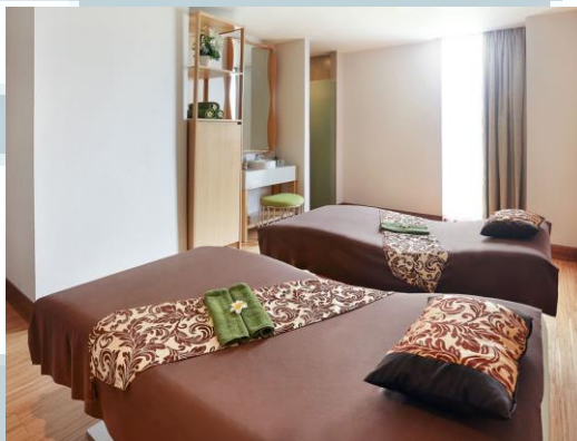
Gambar 2.1.1.2 Spa