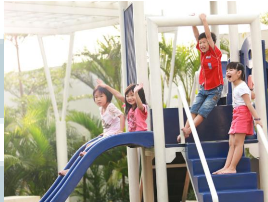
Gambar 2.1.1.2 Children Playground