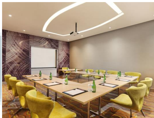
Gambar 2.1.1.2 Meeting Room