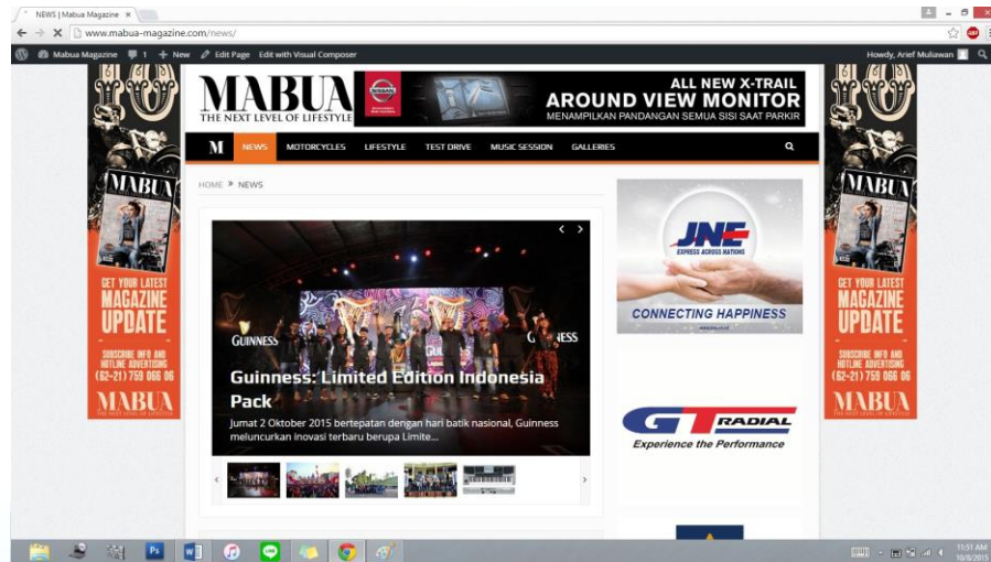
(Gambar 2.3) Tampilan Website Majalah Mabua