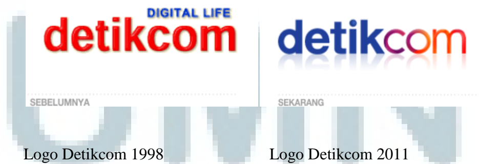
Gambar 2.1 Logo Website Detikcom