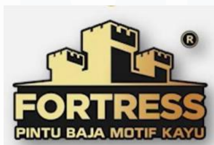
Gambar 2.2 Logo Fortress