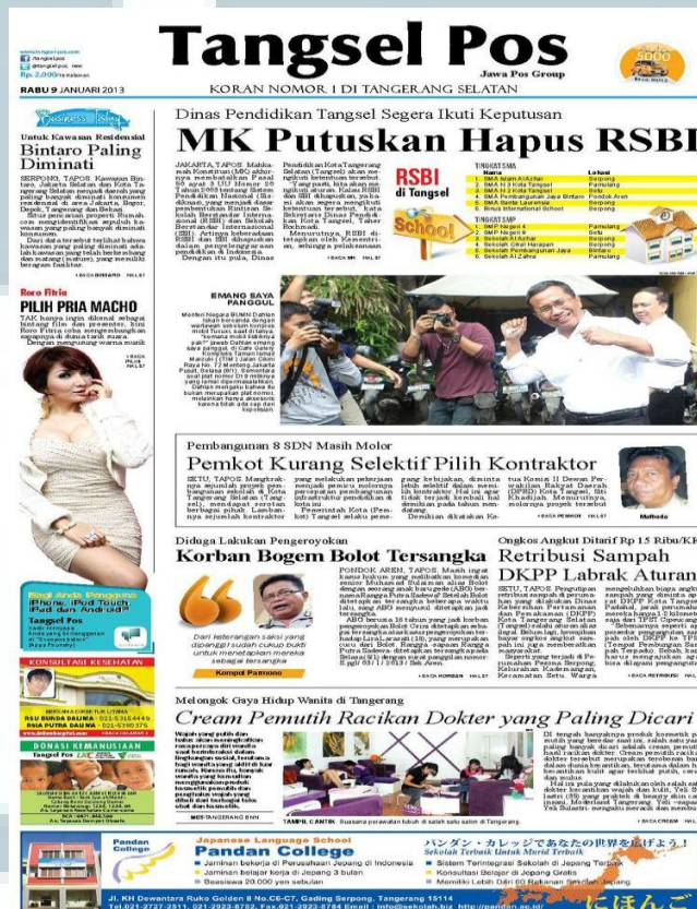
Gambar 2.2 Koran Tangsel Pos

Alasan kenapa menggunakan nama Tangsel Pos karena koran Tangsel Pos didirikan bersamaan dengan hari lahirnya Kota Tangerang Selatan. Kenapa pada kalimat ‘Tangsel Pos’ menggunakan warna hitam, karena mengikuti warna induk dari Jawa Pos Group. Tangsel Pos merupakan anak dari Jawa Pos Group. Arti dari Tagline Tangsel Pos adalah Tangsel Pos ingin menjadi koran nomor 1 di Tangerang Selatan dengan tujuan untuk mengawal perkembangan pembangunan Tangerang Selatan dan mengawal demokratisasi di Tangerang Selatan. Alasan kenapa memilih warna merah pada tagline Tangsel Pos, karena warna merah melambangkan semangat dan keberanian Tangsel Pos dalam menyajikan berita yang proposional.