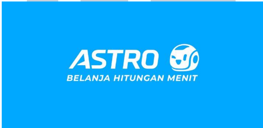
Gambar 2. 1 Logo Astro Technologies Indonesia

Astro Technologies Indonesia (Astro) merupakan perusahaan penyedia layanan belanja daring cepat di Indonesia. Astro menyediakan lebih dari 1.000 produk pilihan yang di dapat diantar ke pelanggan dalam hitungan menit. Layanan ini beroperasi 24 jam sehari, 7 hari seminggu, sepanjang tahun, meskipun selama pandemi, jam operasional disesuaikan sesuai anjuran pemerintah.