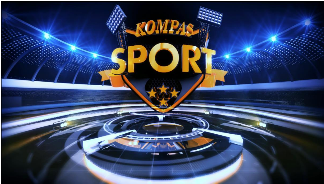
Gambar 4 : Logo Kompas Sport 2015.