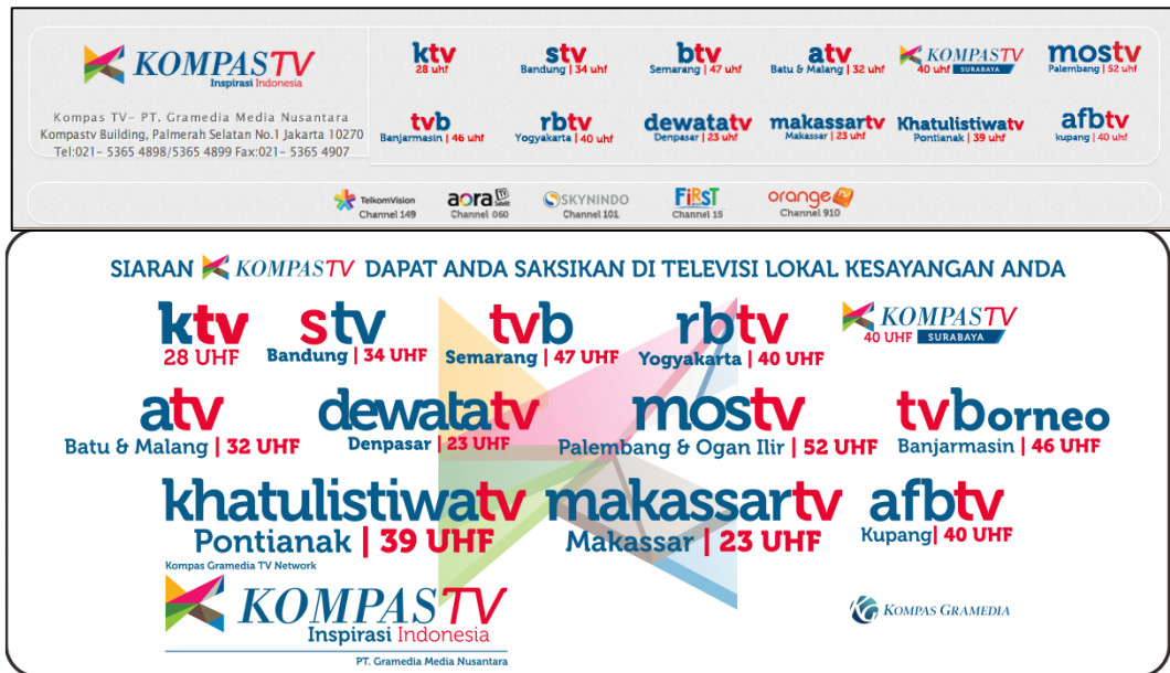
Gambar 2 : Logo Kompas TV yang bersinergi dengan TV Lokal.

Dengan demikian, stasiun televisi lokal memiliki kualitas yang tidak kalah dengan stasiun televisi nasional, tentunya dengan keunggulan kearifan lokal daerah masing-masing.