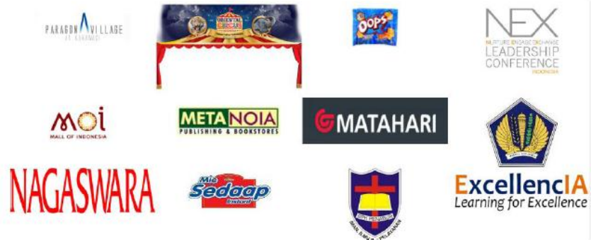
Gambar 2.6 Client Perusahaan