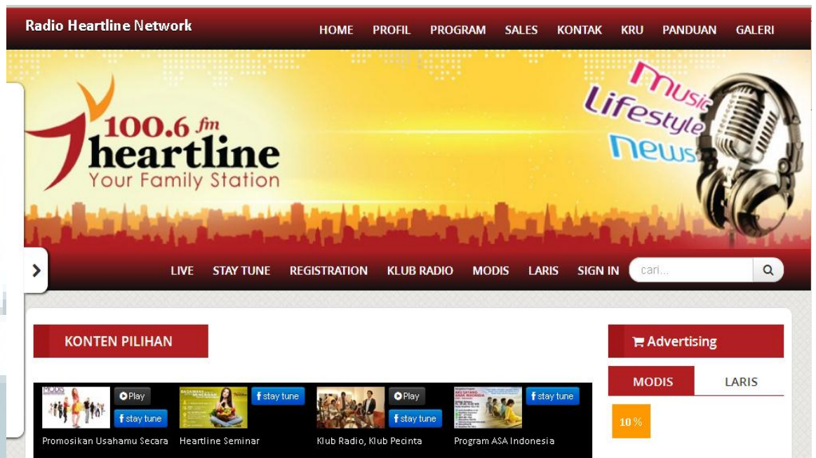
Gambar 2.3 Website Perusahaan ( www.heartlineradio.com )