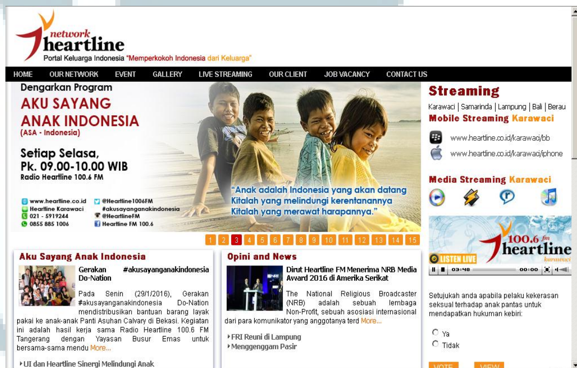
Gambar 2.2 Website Perusahaan