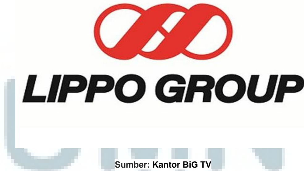
Gambar 2.1: Logo Lippo Group

Bergerak di bidang properti meliputi kota satelit, perumahan, kondominium, perkantoran kelas A, pusat industri, pusat belanja, hotel, golf dan rumah sakit. Selain di Indonesia juga memiliki properti sejenis di Tiongkok dan Singapura. Di bisnis eceran menguasai beberapa usaha seperti Matahari Putra Prima meliputi Foodmart, Matahari Dept. Store dan Hypermart serta eceran di produk kesehatan dan kecantikan. Memiliki usaha di bidang media, telekomunikasi, teknologi informasi dan TV kabel. Jasa keuangan seperti perbankan, asuransi, dan lainnya dengan fokus di Asia.