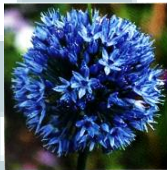
Logo Allium Tangerang Hotel