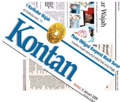
Gambar 2.1 Logo Awal Kontan

media untuk masyarakat modern. Maka dari itu, Kontan secara resmi mengganti logo identitasnya ini pada Maret 2010.