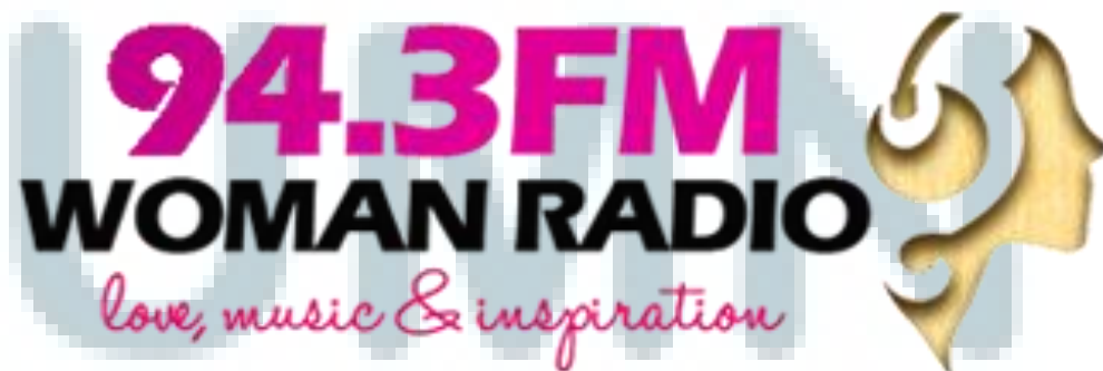
Gambar 2.2 Tagline Woman Radio : Love, Music & Inspiration