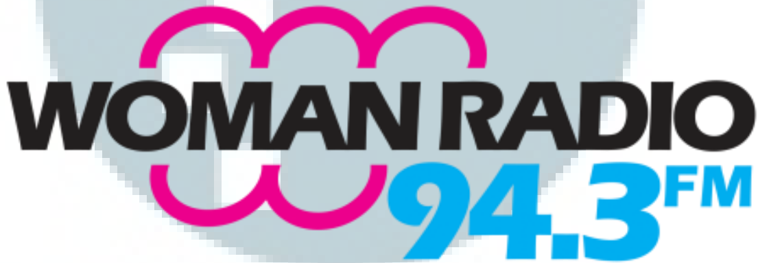
Gambar 2.1 Logo Woman Radio