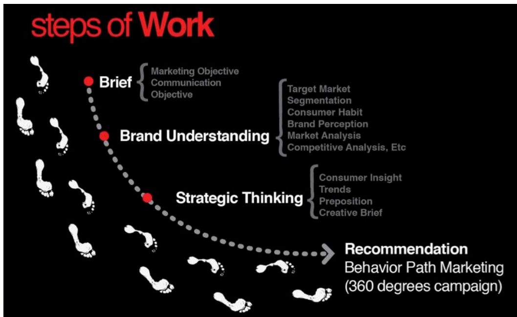
Gambar 2.2 Steps of Work REDMARK