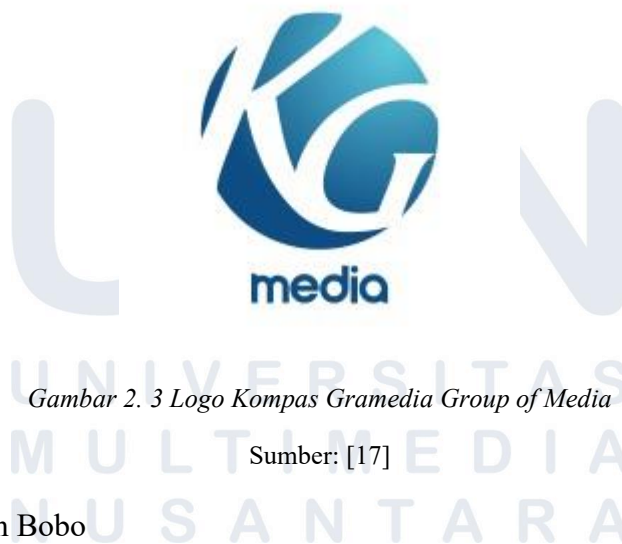
Gambar 2. 3 Logo Kompas Gramedia Group of Media

Sebagai salah satu unit bisnis Kompas Gramedia, Group of Media atau yang biasa disebut dengan KG Media, berperan dalam mengembangkan berbagai saluran komunikasi dan informasi bagi masyarakat Indonesia. Divisi ini mencakup berbagai entitas media seperti surat kabar, portal berita online, dan majalah dengan total 150 merk [15]. Semuanya berfokus untuk memberikan informasi berkualitas dan relevan dengan perkembangan zaman. Visinya adalah Telling Stories That Matter, Making Impact That Lasts [16]. Logo resminya dapat dilihat pada Gambar 2.3. Berikut merupakan beberapa merknya: