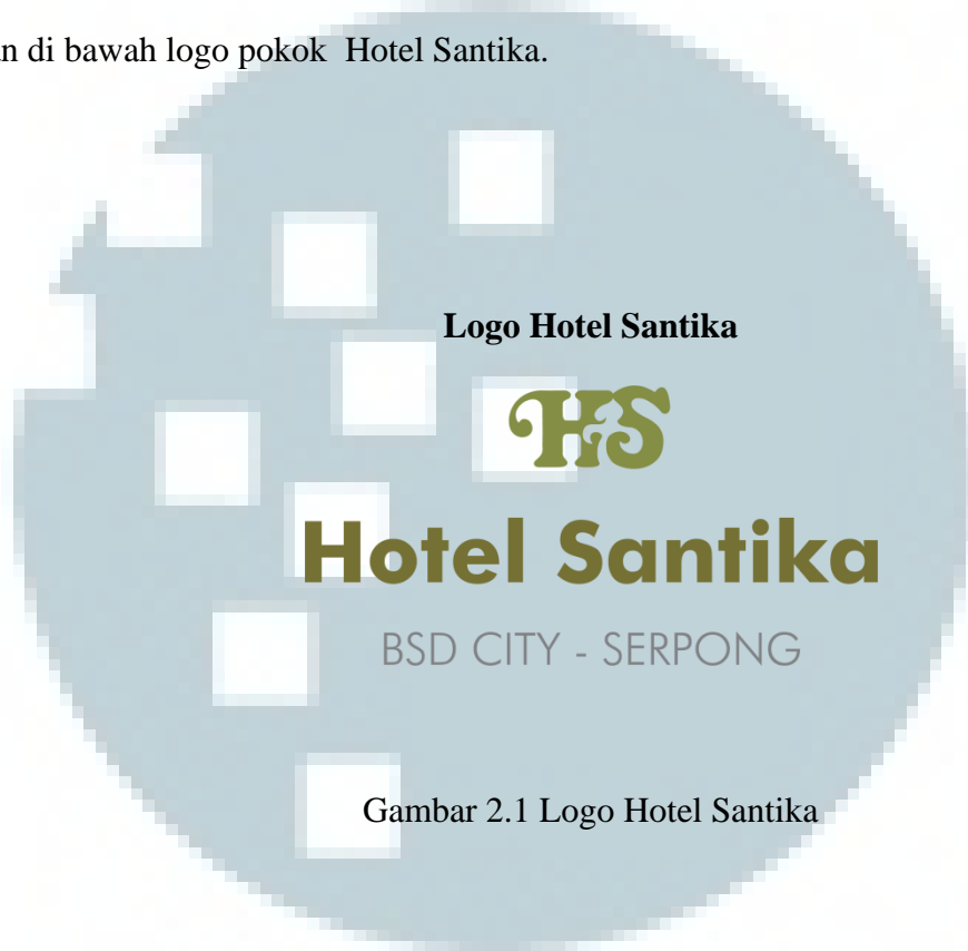
Gambar 2.1 Logo Hotel Santika

“Hospitality from the Heart sangat terlihat di antara logo h dan s terletak ukiran batik yang membuat logo tersebut menceritakan bahwa Hotel Santika amat bernuansa Indonesia. Kejiwaan, manajemen dan brand Santika (By Santika) terlihat jelas pada tulisan di bawah logo pokok Hotel Santika.