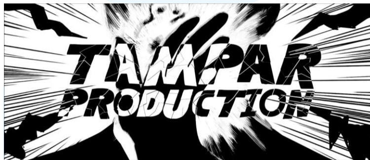
Gambar 2.1. Logo Tampar Production

Tampar Production merupakan studio visual efek yang berawal dari sebuah kelompok freelance dengan minat dan keahlian di bidang animasi serta efek visual. Seiring perkembangannya, Tampar Production kemudian berkembang menjadi studio profesional yang berfokus pada pembuatan CGI, compositing , dan animasi yang berbasis di Yogyakarta. Berdiri sejak tahun 2013, Tampar Production menyediakan layanan visual efek secara menyeluruh untuk berbagai kebutuhan, seperti film, periklanan, dan konten digital. Sebagai studio yang bergerak di bidang industri kreatif, Tampar Production terus mengembangkan inovasi dalam setiap proyeknya untuk menghasilkan karya visual yang berkualitas dan memiliki nilai artistik tinggi.