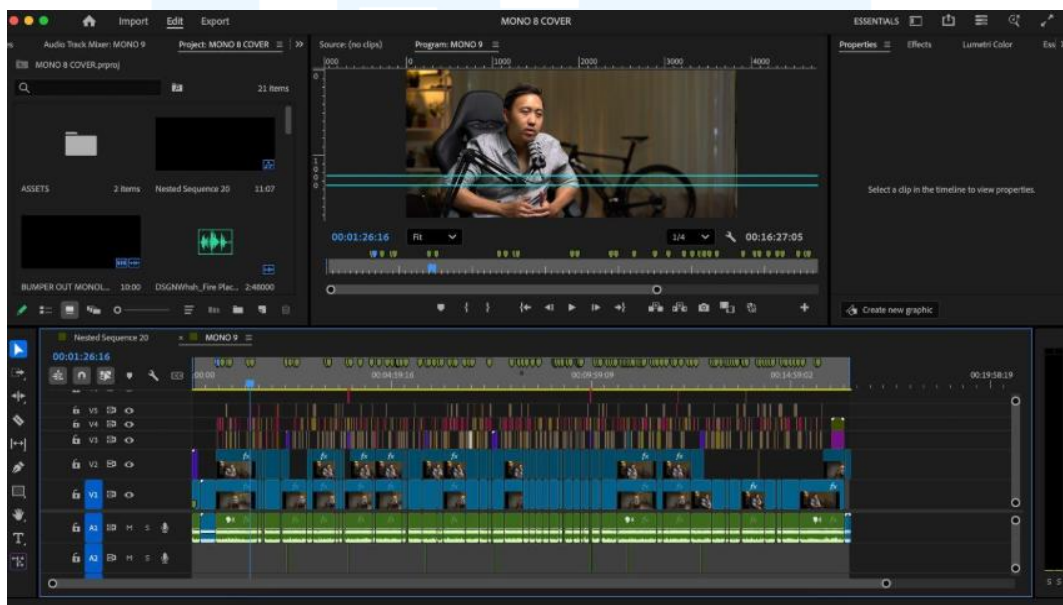
Gambar 3.2.2.3. Timeline Monologue.

Penulis mengerjakan proyek Monologue ini untuk YouTube longform . Sebelum mengerjakan video longform Monologue, penulis diberikan brief oleh supervisor untuk mengerjakan video tersebut menggunakan format berdasarkan yang telah dijelaskan dengan menggunakan motion graphic . Setelah itu penulis mulai mengerjakan video tersebut dengan memasukkan text terlebih dahulu dan sound effect . Kemudian setelah memasukan semua dan videonya telah selesai, penulis akan menginformasikan di grup bahwa video konten longoform telah selesai.