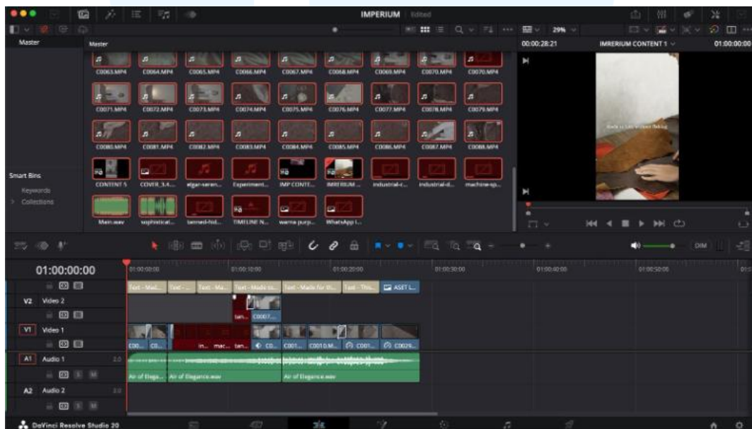
Gambar 3.2.2.1. Timeline Imperium Leather.

Creativera memiliki sistem penjadwalan melalui google calendar , dimana semua pekerja mengetahui letak deadline , meeting , dan yang lainnya. Diawali dari brand tersebut approach pada tim marketing untuk mengeksekusi company profile dari imperium leather tersebut. Tim creativera diberi brief dan penulis diminta oleh tim creative agar memberikan ide moodboard untuk feeds instagramnya nanti.