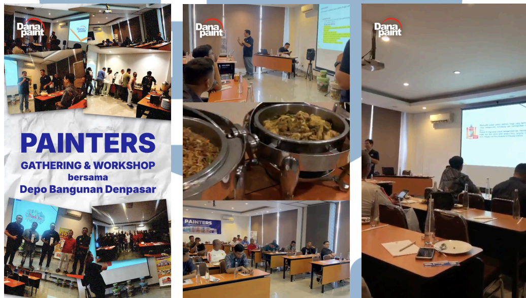
Gambar 3.2 Contoh konten event Danapaint Painters Gathering di Denpasar

menunggu approval terhadap video yang telah dikirim apabila terdapat revisi maka penulis akan segera melakukan revisi video tersebut sesuai dengan arahan pihak Danapaint dan menyerahkan kembali ke pihak Danapaint. Setelah video telah disetujui oleh pihak Danapaint, maka video akan diunggah oleh Social Media Interns pada akun Instagram Danapaint. Secara total, penulis telah membuat konten event Danapaint sebanyak 4 video yang diantaranya adalah Painters Gathering Denpasar, Painters Gathering Depo Bangunan, Painters Gathering Mitra 10 Surabaya, dan Mitra10 Home Renovation Expo 2025 .