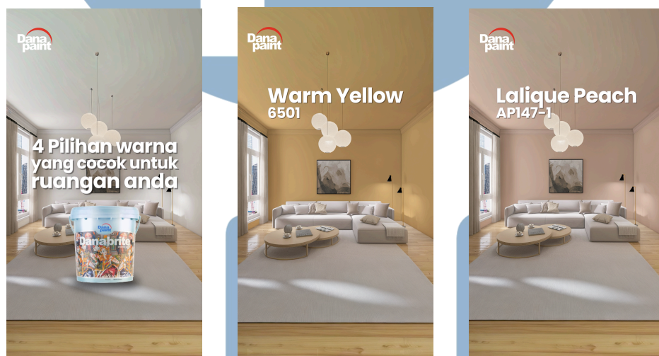
Gambar 3.4 Contoh hasil konten motion graphic Danapaint

referensi yang diberikan kepada penulis. Selanjutnya, penulis menambahkan sekaligus menganimasikan teks-teks yang berisi informasi tentang kegunaan cat Danapaint. Tahap terakhir dalam pembuatan konten motion graphic Danapaint adalah menambahkan suara pada konten yang telah dibuat. Penulis menambahkan terlebih dahulu musik latar yang diunduh dari website Epidemic Sound dan Youtube serta menambahkan efek suara agar video konten terlihat lebih hidup dan natural. Video konten yang telah diekspor akan diserahkan kepada pihak Danapaint untuk menunggu persetujuan apabila terdapat revisi maka penulis akan melakukan revisi sesuai arahan pihak Danapaint. Secara total, penulis telah membuat sebanyak 6 video motion graphic untuk keperluan konten Danapaint.