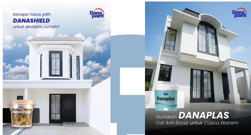
Gambar 3.6 Contoh hasil photoshoot Danapaint di Citra Garden Bintaro