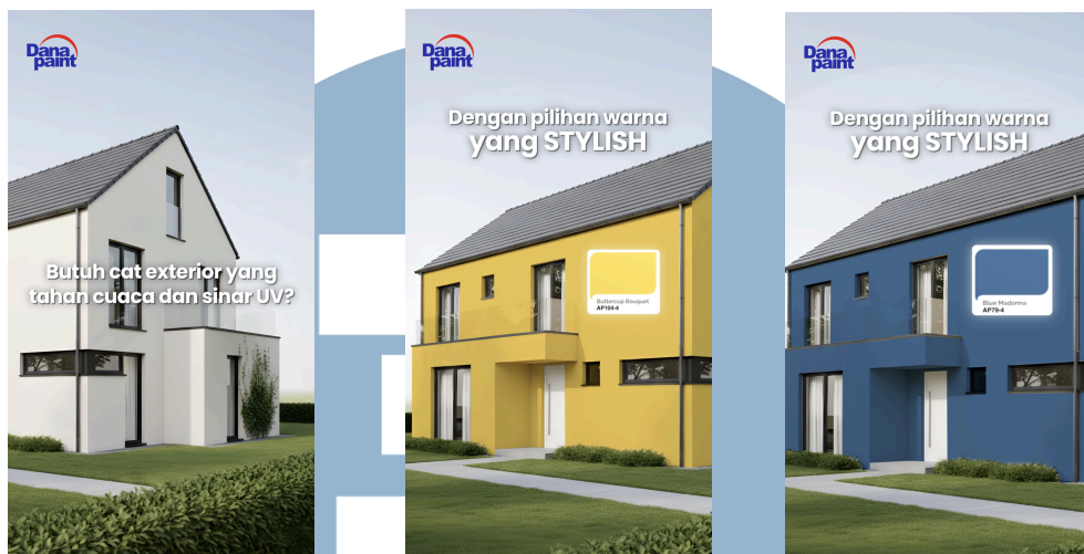
Gambar 3.5 Contoh hasil konten motion graphic Danapaint