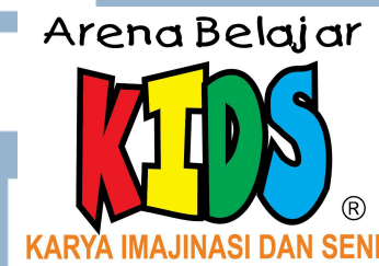
Gambar 2.1.1 Logo Arena Belajar KIDS

Arena Belajar KIDS merupakan salah satu institusi pendidikan anak usia dini (PAUD) dengan rekam jejak terpanjang di Balikpapan. Didirikan pada tahun 2000, lembaga ini telah mendedikasikan diri selama 25 tahun untuk berkontribusi dalam peningkatan kualitas pendidikan anak-anak di Indonesia, khususnya di wilayah Balikpapan, Kalimantan Timur.