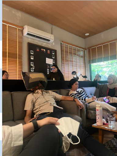
Gambar 3.2.4. Feedback setelah screening internal.

Selain terlibat dalam proses pengembangan awal, penulis juga berpartisipasi dalam sesi screening dan reading script project yang telah mencapai tahap revisi lanjut. Dalam kegiatan ini, penulis bertugas mencatat hasil feedback dari tim development dan memberikan pandangan dari sudut pandang penonton. Proses ini menjadi bagian penting dari evaluasi internal Visinema untuk menjaga kualitas cerita dan memastikan setiap project memiliki kedalaman pesan serta relevansi dengan penonton.