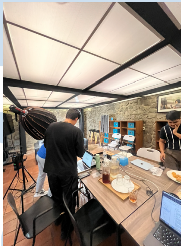
Gambar 3.2.3. Riset Wawancara.

Selain melakukan pencatatan rapat, penulis juga ikut terlibat dalam proses riset awal untuk beberapa project yang masih berada pada tahap pengembangan ide. Riset dilakukan dengan mencari referensi sosial, dan budaya yang relevan dengan tema project .