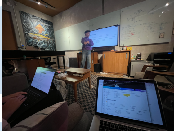
Gambar 3.2.6. Brainstorming dan Development dari hasil riset.

Project ini merupakan karya orisinal yang dikembangkan di bawah divisi Skriptura Visinema Pictures. Project ini ditulis oleh salah satu penulis Visinema dan diproduksi oleh salah satu produser di Visinema, dengan gagasan utama yang berangkat dari isu sosial mengenai dampak pemutusan hubungan kerja ( layoff ) terhadap kehidupan individu dan keluarga. Project ini mencoba memotret sisi manusiawi dari proses kehilangan dan upaya menemukan makna baru dalam hidup.