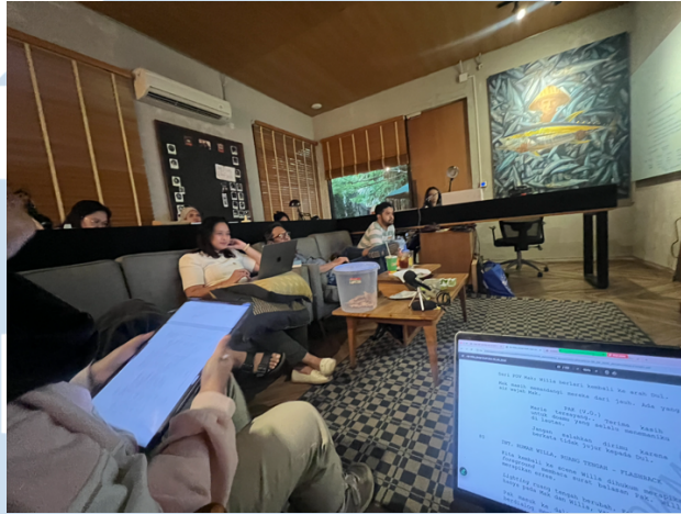
Gambar 3.2.1. Reading dan Feedback Script.

Berdasarkan tabel kegiatan di atas, penulis secara rutin terlibat dalam kegiatan story development meeting untuk berbagai project film dan series . Setiap rapat membahas perkembangan naskah, evaluasi struktur cerita, serta penyusunan ide untuk pengembangan episode berikutnya.