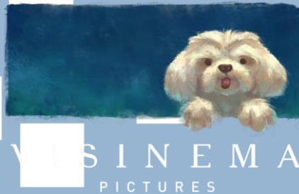
Gambar 2.1.1 Logo Visinema Pictures.

Visinema Pictures adalah sebuah rumah produksi film yang didirikan oleh Angga Dwimas Sasongko pada tahun 2008 yang awalnya berfokus pada produksi iklan dan video musik. Pada tahun 2014, Visinema Pictures mulai terjun dalam ke layar lebar dengan film Cahaya Dari Timur: Beta Maluku . Pada tahun 2020, Visinema Pictures berhasil memperoleh pendanaan A dengan nilai US$3,25 juta dari Intudo Ventures (Eka, 2020). Visinema Pictures fokus melakukan pengembangan IP (intellectual property) dan telah memenangkan berbagai penghargaan bergengsi seperti Festival Film Indonesia dan Piala Maya ( IDFilmCenter , n.d.). Hingga saat ini, rumah produksi Visinema Pictures telah memproduksi berbagai film layar lebar yang sukses dan menjadi box office diantaranya adalah Keluarga Cemara (2019), Nanti Kita Cerita Tentang Hari Ini (2020), Mencuri Raden Saleh (2022), 13 Bom di Jakarta (2023), dan Home Sweet Loan (2024) (Nugraha, 2025).