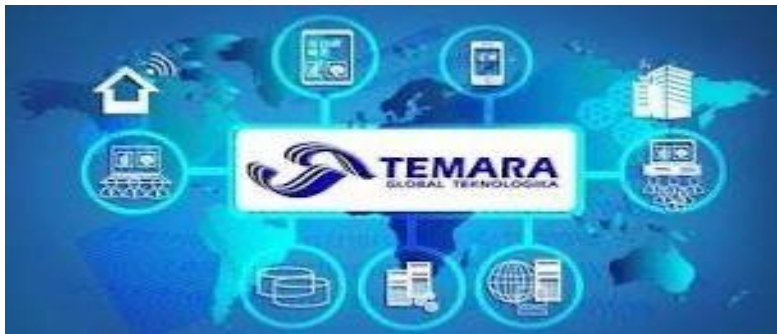
Gambar 2.2 Layanan PT Temara Global Teknologika