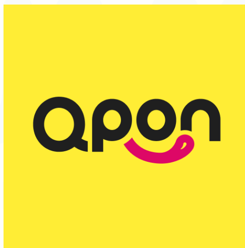
Gambar 2.1 Logo PT QPON Digital Indonesia

PT QPON Digital Indonesia merupakan perusahaan yang menyediakan platform layanan diskon terkemuka di Indonesia yang diluncurkan oleh PT OPPO pada tahun 2023. Letak perusahaan ada di RDTX Place, Kuningaan, Jakarta Selatan lantai 18. Perusahaan ini memiliki fokus untuk memberikan layanan kepada pengguna untuk menikmati diskon pada layanan gaya hidup, makanan minuman, hiburan, layanan, dan lainnya. QPON merupakan perusahaan subsidiary dari perusahaan PT OPPO yang berasal dari Shenzhen, Tiongkok. Aplikasi platform tersebut yaitu QPON : Daily Deals and Coupon yang dapat diunggah melalui appstore ataupun playstore melalui HP ( Handphone ) pribadi masing-masing. Platform QPON didirikan sebagai sebuah solusi digital dalam memberikan layanan diskon untuk lifestyle services bagi pelanggannya. Saat ini, QPON hadir untuk membantu pelaku usaha restoran ataupun UMKM dalam meningkatkan sistem pemasaran dan penjualannya agar lebih efisien dan modern sesuai dengan perkembangan teknologi digital.