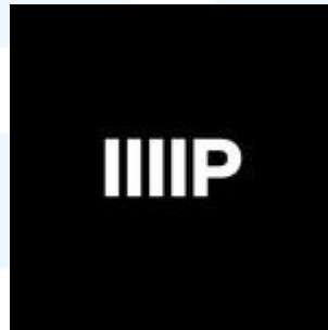
Gambar 2.1 Logo Parallel studio

Parallel Studio adalah studio yang berfokus pada tahap post production , khususnya pada bidang color grading dan online editing . Studio ini didirikan oleh Agung Pambudi serta Kenzo Miyake, pada tahun 2019. Parallel Studio berlokasi di daerah Kebayoran Baru, Jakarta Selatan, tepatnya di jalan Damai II No.2G, RT.11/RW.5, Cipete Utara. Studio ini telah menangani project yang bervariasi, mulai dari music video , iklan TVC, film pendek, maupun film panjang. Beberapa proyeknya yaitu Swipe Right Series dari merek Vidio.com, iklan TVC untuk HUT ke 100 merek Kapal Api, juga konten iklan untuk merek Uniqlo.