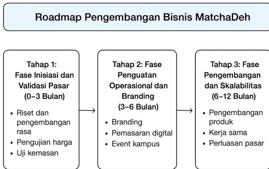
Gambar 3.4 RoadMap MatchaDeh