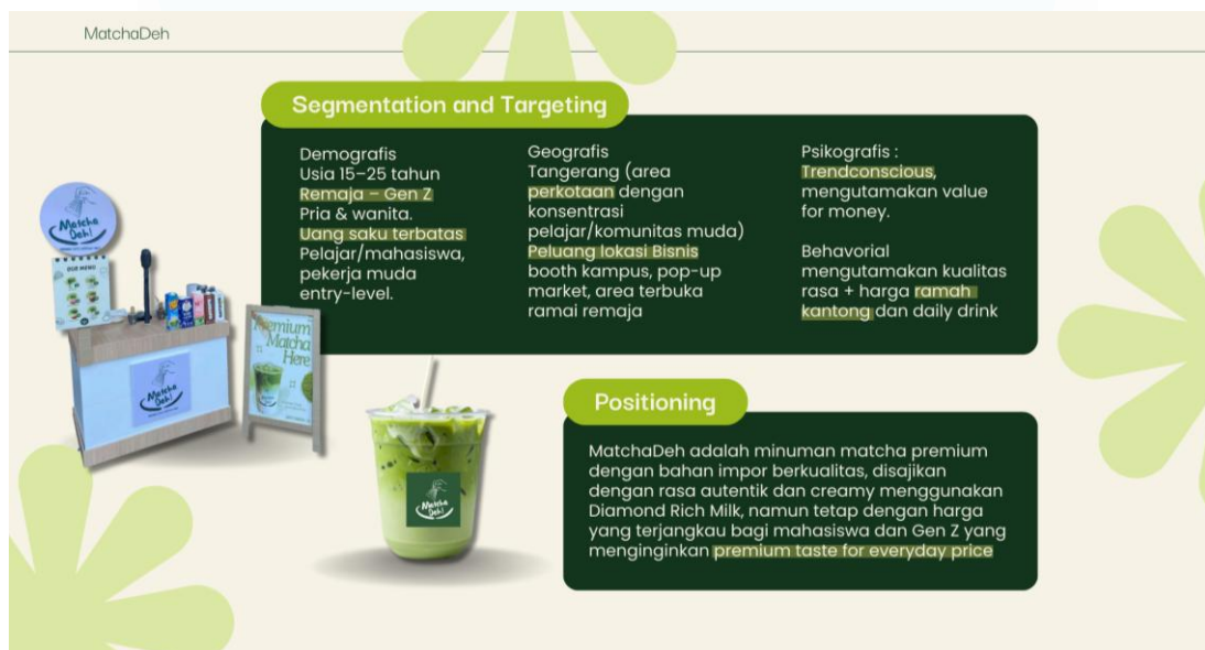
Gambar 3.3 Strategi Pemasaran MatchaDeh

Strategi pemasaran MatchaDeh disusun berdasarkan prinsip marketing mix untuk memastikan produk mampu bersaing di pasar F&B khususnya minuman berbahan dasar matcha yang saat ini semakin kompetitif. Dalam pengembangannya, MatchaDeh memfokuskan diri pada konsistensi kualitas produk, penetapan harga yang sesuai dengan nilai ( value ), pemilihan lokasi yang dekat dengan target konsumen, serta promosi digital yang relevan dengan karakteristik Gen Z sebagai target utama. Penyusunan strategi ini juga mempertimbangkan celah pasar yang diidentifikasi pada tahap riset, yaitu kurangnya pilihan minuman matcha premium