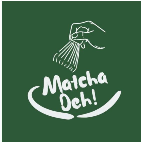
Gambar 3.1 Logo MatchaDeh

Menjadi brand minuman matcha terjangkau yang dikenal luas karena kualitas premium, rasa khas, dan pengalaman konsumsi yang menyenangkan bagi semua kalangan.