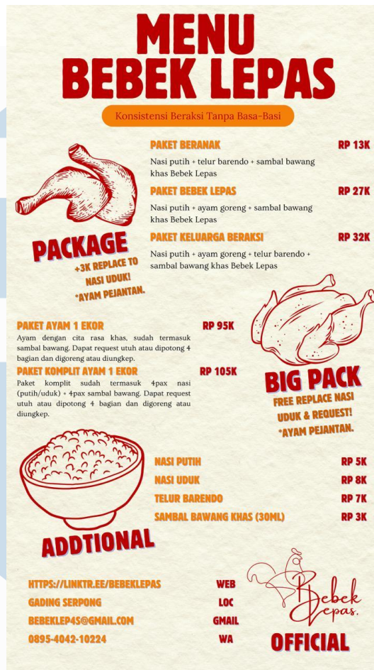
Gambar 3.3 Menu Bebek Lepas

Dengan perhitungan tersebut, margin keuntungan kotor mencapai 27 35% per porsi, tergantung pada variasi menu dan volume penjualan. Target penjualan minimal 60-65 porsi per hari telah mampu menutupi biaya operasional sekaligus menghasilkan laba bersih yang stabil. Selain itu, potensi pendapatan tambahan dapat diperoleh melalui penjualan daring di platform GoFood, GrabFood, serta rencana kerja sama kemitraan jangka panjang dalam bentuk mini franchise. Berdasarkan evaluasi terhadap efisiensi biaya, perhitungan modal, dan potensi pasar, aspek finansial usaha Bebek Lepas dinilai sangat layak untuk dijalankan karena memiliki proyeksi keuntungan positif serta tingkat risiko yang terkendali.