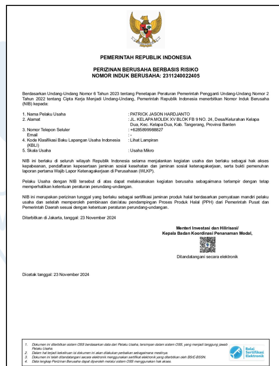
Gambar 2.2 Sertifikat Nomor Induk Berusaha (NIB)

Setelah seluruh tahapan pengisian data dan verifikasi dokumen dinyatakan lengkap, sistem OSS secara otomatis menerbitkan NIB beserta izin usaha mikro. Dengan diterbitkannya NIB tersebut, Grombi secara resmi memiliki dasar hukum yang kuat untuk menjalankan kegiatan operasionalnya. Legalitas ini juga memberikan kemudahan bagi Grombi dalam mengakses layanan administratif lainnya, seperti pembukaan rekening usaha, pengurusan pajak, serta partisipasi dalam program pengembangan Usaha Mikro, Kecil, dan Menengah (UMKM) yang difasilitasi oleh pemerintah.