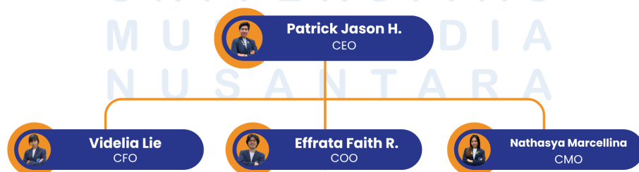
Gambar 2.1 Struktur Organisasi Grombi

Struktur organisasi Grombi dirancang dengan tujuan untuk memastikan seluruh kegiatan operasional dapat berlangsung secara efisien, teratur, dan saling terkoordinasi. Adapun susunan struktur organisasi Grombi dapat dijelaskan sebagai berikut.