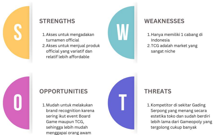
Gambar 2. 2 SWOT Analysis Gameopoly Board Game & Café