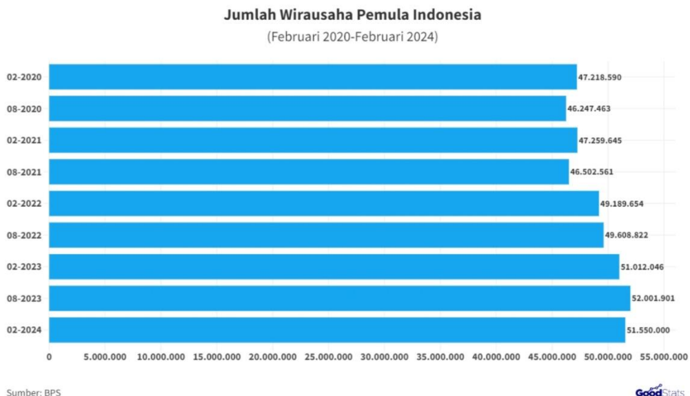
Gambar 1.1 Jumlah Wirausaha Pemula Indonesia

Akan tetapi kewirausahaan pemula di Indonesia terbilang berkurang, Hal ini dapat dilihat dari data Badan Pusat Statistik per Februari 2024 terdapat sebanyak 51,55 juta wirausaha pemula di Indonesia yang pada tahun sebelumnya mencapai 52 juta jiwa wirausaha pemula.