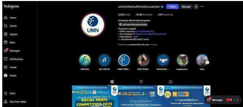
Gambar 2.3 1 Instagram Universitas Multimedia Nusantara

Gambar diatas tersebut merupakan gambar Instagram UMN yang berisi tentang link untuk situs berikut di bawah ini.