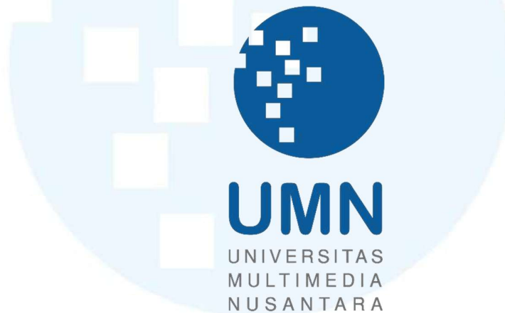
Gambar 2.1 | Gambar Logo UMN (Universitas Multimedia Nusantara) Sumber: Universitas Multimedia Nusantara (2005)

Fakultas Teknik dan Informatika yang menawarkan program studi seperti Teknik Informatika, Sistem Informasi, Teknik Elektro, dan Sains Data; Fakultas Ilmu Komunikasi dengan program studi Ilmu Komunikasi dan Jurnalistik; Fakultas Seni dan Desain yang mencakup Desain Komunikasi Visual, Film, dan Animasi; serta Fakultas Ekonomi dan Bisnis yang menyediakan program studi Manajemen dan Akuntansi, termasuk peminatan bisnis digital. Sebagai status swasta, Universitas Multimedia Nusantara (UMN) berkomitmen untuk menjaga mutu pendidikan, inovasi, dan daya saing global sambil mengibarkan bendera logo mereka berikut.