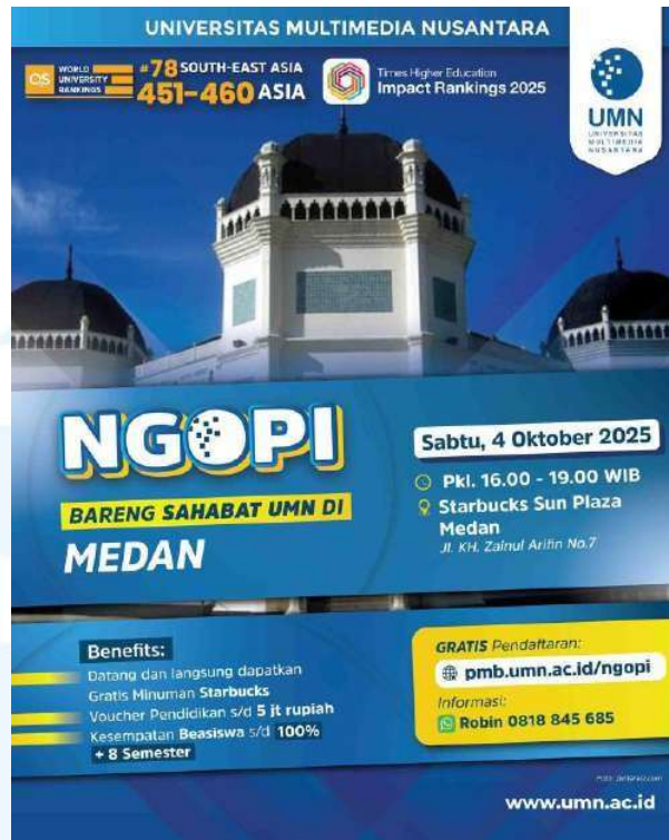
Gambar 2.3 3 Poster Universitas Multimedia Nusantara Ngopi bareng Sahabat UMN di Medan

Dan dari Poster di atas yang merupakan contoh dari situs event yang dipublikasikan oleh Universitas Multimedia Nusantara (UMN) kapan untuk dilaksanakan berserta ketentuan untuk pendaftaran recruit yang baru. Selalu sedia dan siap untuk para recruit yang baru untuk datang ke Universitas Multimedia Nusantara (UMN). Tidak perlu hanya memerlukan nilai yang bagus, tapi butuh juga bakat dan minat mereka sejak kecil hingga sekarang untuk masa magang dan karier nanti.