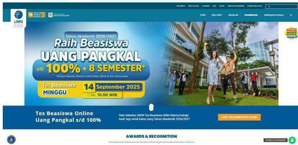
Gambar 2.3 2 Website Universitas Multimedia Nusantara

Gambar diatas tersebut merupakan gambar Instagram UMN yang berisi tentang link untuk situs berikut di bawah ini.