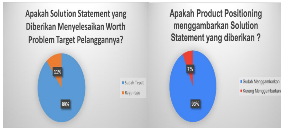
Gambar 1.2 Survey Pasar

Melalui program Professional Skill Enhancement Program (PRO-STEP), penulis sebagai Chief Financial Officer (CFO) CHEERMOL ingin memperkuat kemampuan profesional di bidang kewirausahaan, terutama dalam manajemen keuangan. Diharapkan, CHEERMOL dapat menjadi proyek rintisan yang berkelanjutan, memberikan kontribusi nyata bagi pengembangan industri camilan lokal, serta menciptakan lapangan kerja bagi generasi muda Indonesia.