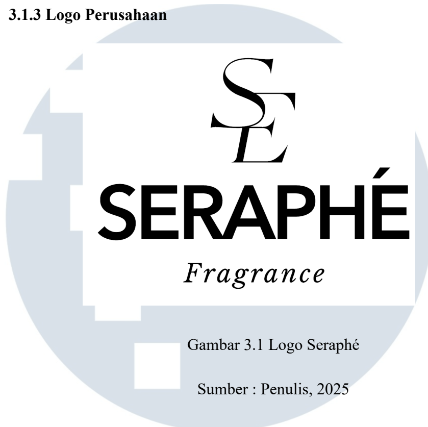
Gambar 3.1 Logo Seraphé