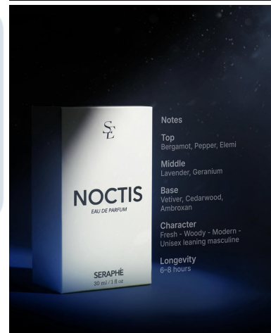
Gambar 3.2 3 Varian Produk Seraphe