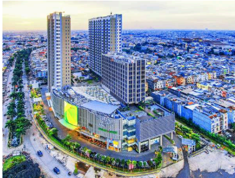
Gambar 2.1 Green Sedayu Mall

Green Sedayu Mall merupakan salah satu proyek unggulan AMANTARA yang dikelola oleh PT. Citra Kirana Hijau Retail dan berdiri di atas lahan seluas 2,2 hektar di Jakarta Barat. Kawasan ini tidak hanya menghadirkan pusat perbelanjaan, tetapi juga terintegrasi dengan dua tower apartemen, yaitu Tower Pasadena dan Tower New York , serta Hotel Hilton Garden Inn. Sejak resmi dibuka pada 31 Juli 2020, Green Sedayu Mall Mengusung konsep Culinary & Lifestyle Mall dengan tenant yang didominasi oleh sektor makanan dan minuman.