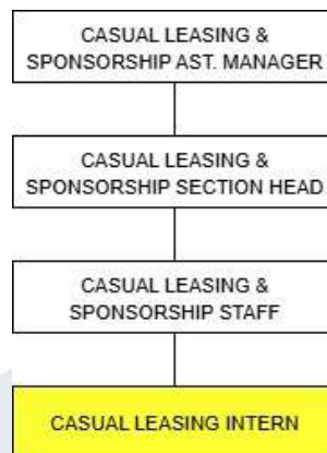
Gambar 2.5 Struktur Divisi Casual Leasing & Sponsorship

Pada divisi Casual Leasing & Sponsorship terdapat Casual Leasing & Sponsorship Assistant Manager dan Casual Leasing & Sponsorship Section Head yang menaungi Casual Leasing & Sponsorship Staff dan Casual Leasing Intern . Pekerjaan yang dilakukan oleh setiap anggota divisi Casual Leasing & Sponsorship adalah sebagai berikut: