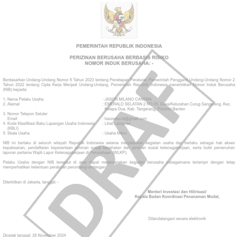
Gambar 2.2 NIB (Nomor Induk Berusaha)