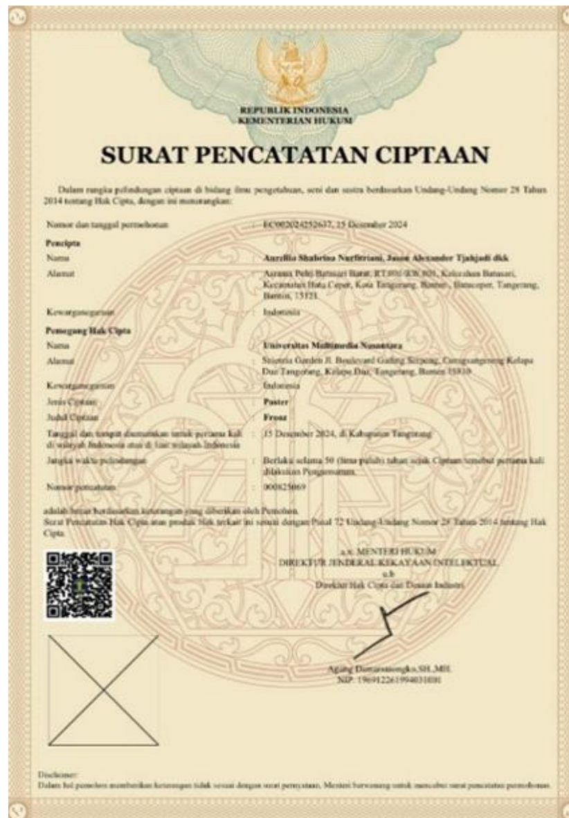
Gambar 2. 3 Hak Kekayaan Intelektual Frooz

pembuatan HKI akan dibantu oleh Universitas Multimedia Nusantara, sehingga dengan resmi karya Frooz mendapatkan perlindungan hukum.