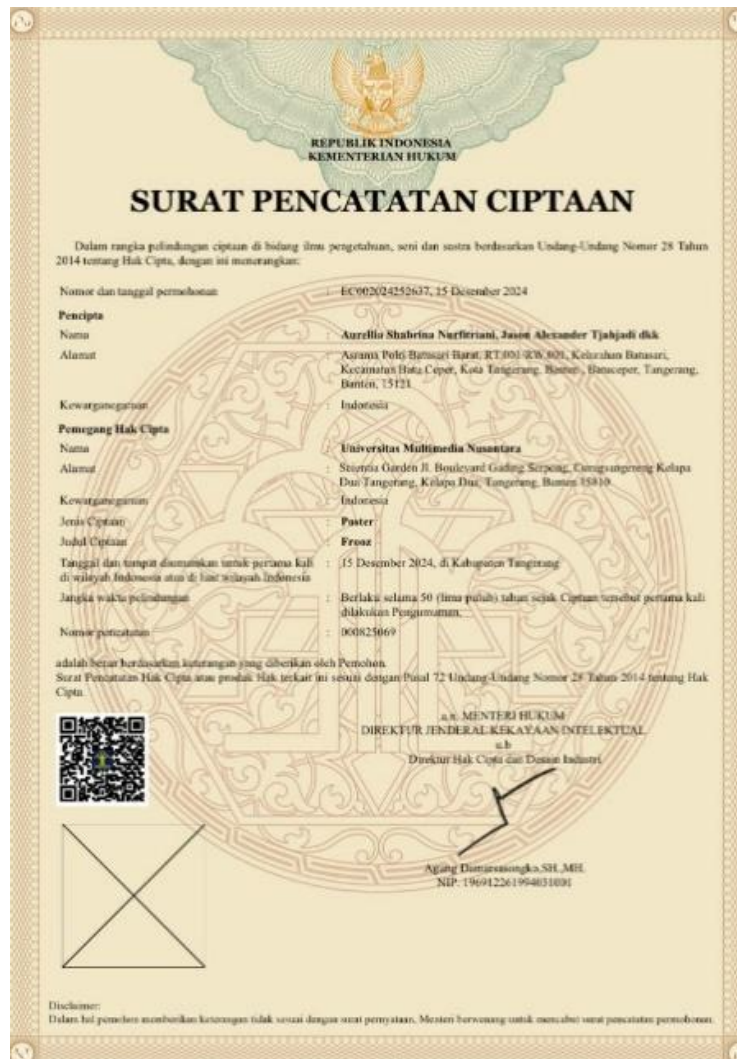
Gambar 2. 3 Hak Kekayaan Intelektual Frooz