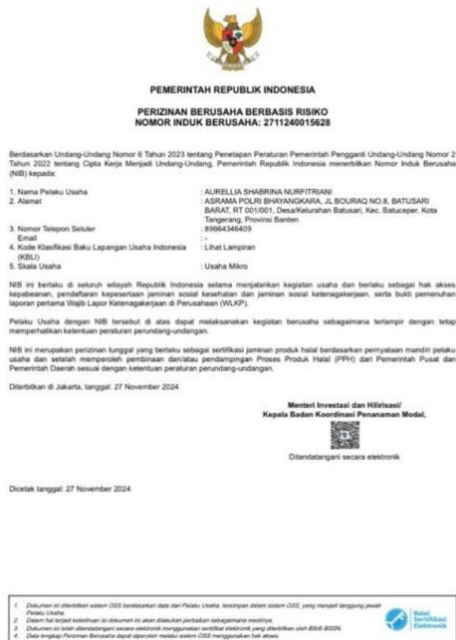
Gambar 2. 2 Nomor Induk Berusaha (NIB) Frooz

Selain NIB, Frooz juga terdaftar dalam Hak Kekayaan Intelektual (HKI) dengan pemegang hak cipta atas nama Universitas Multimedia Nusantara. Proses pembuatan HKI dilakukan dengan mengumpulkan dokumen-dokumen penting seperti, soft copy KTP dari setiap anggota dan supervisor, lampiran karya, deskripsi ciptaan, form pernyataan ciptaan, hingga form pengalihan hak cipta, untuk selanjutnya dikirimkan melalui email hki@umn.ac.id . Setelah itu seluruh proses pembuatan HKI akan dibantu oleh Universitas Multimedia Nusantara, sehingga dengan resmi karya Frooz mendapatkan perlindungan hukum.