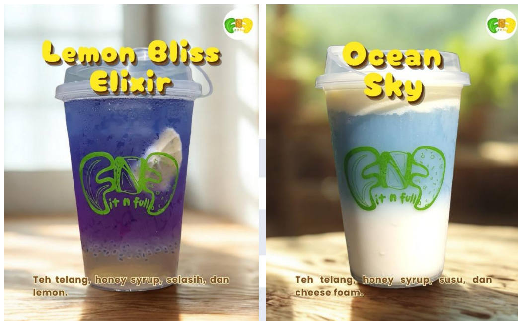
Gambar 1.4 Produk Minuman FITNFULL

Melalui pendekatan ini, FITNFULL tidak hanya hadir sekedar sebagai produk makanan dan minuman, tetapi juga sebagai bentuk kontribusi nyata tim dalam mempromosikan gaya hidup yang lebih sehat melalui produk yang bergizi dan praktis, serta masih bersahabat dengan kantung mahasiswa dan pekerja. Selain itu, FITNFULL juga turut berkontribusi terhadap pencapaian Tujuan Pembangunan Berkelanjutan (Sustainable Development Goals/SDGs), yaitu SDG 3 (Good Health and Well-Being), khususnya Target 3.4, yaitu mengurangi risiko penyakit tidak menular melalui pencegahan dan pola hidup sehat. FITNFULL mendukung target ini melalui penyediaan produk makanan dan minuman yang mengedepankan kandungan gizi seimbang, tinggi protein, serta rendah gula dan lemak jenuh. Upaya ini diharapkan dapat mendorong konsumen untuk menerapkan pola makan yang lebih sehat dan teratur, sehingga secara tidak langsung berkontribusi pada pencegahan penyakit tidak menular seperti diabetes dan penyakit kardiovaskular, sebagaimana tercermin dalam indikator 3.4.1.