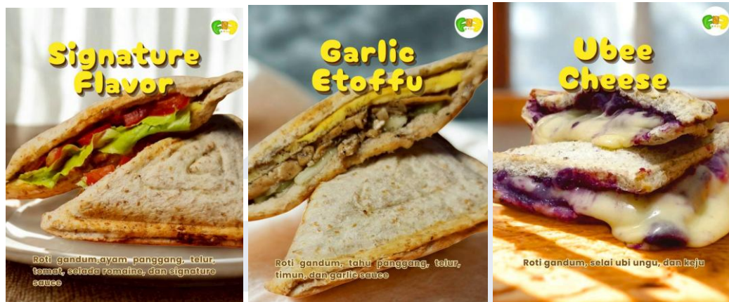
Gambar 1.3 Produk Makanan FITNFULL

sandwich toast FITNFULL, karena lebih tinggi serat dengan isian kaya protein dan serat yang bermanfaat bagi kesehatan.