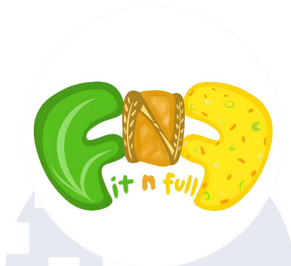
Gambar 1.2 Logo FITNFULL

Berdasarkan proses brainstorming , ide bisnis FITNFULL dirancang melalui tahapan design thinking , dimana ide bisnis terinspirasi dari konsep produk Cheese Toast yang dijual di minimarket 7-Eleven Thailand, karena kepraktisannya. Kemudian, ide bisnis ini divalidasi melalui wawancara kepada kurang lebih 30 narasumber dari kalangan mahasiswa dan pekerja berumur 17-40 tahun yang memiliki pola makan tidak teratur akibat keterbatasan waktu. Dari rangkaian proses design thinking , telah didapat gambaran bahwa mayoritas narasumber membutuhkan makanan yang praktis namun tetap bergizi. Maka dari itu, FITNFULL hadir sebagai produk sandwich toast yang bergizi, lezat, dan mengenyangkan, serta dapat dikonsumsi kapan saja dan di mana saja. Hal ini didukung dari pernyataan Buchr (2023), dimana sandwich juga merupakan salah satu makanan Grab and Go Meals yang diminati oleh masyarakat. Dengan demikian, saat ini, FITNFULL menawarkan tiga sandwich toast , dimana pada varian pertama sandwich toast savory bernama “Signature Flavor” berisi roti gandum, dada ayam panggang, telur, signature sauce , dan empat jenis sayuran. Sementara, untuk varian kedua sandwich toast savory bernama “Garlic Etoffu” berisi roti gandum, tahu panggang, telur, garlic sauce , dan timun. Sementara, untuk varian ketiga sandwich toast sweet bernama “Ubee Cheese” berisi roti gandum, selai ubi, dan keju, seperti pada gambar 1.3. Roti gandum dipilih untuk setiap