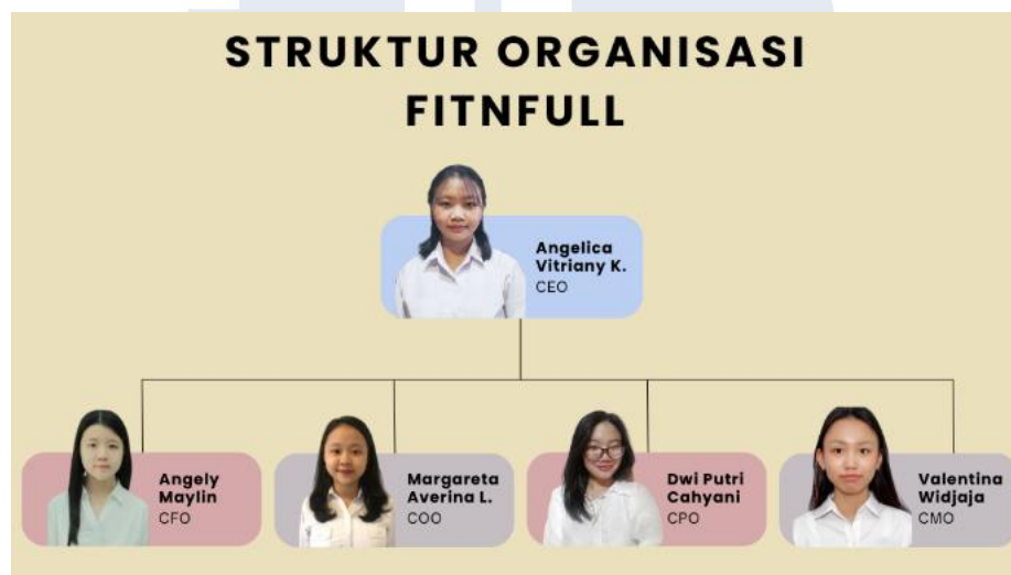
Gambar 2.1 Struktur Organisasi FITNFULL

penentuan prioritas berdasarkan kebutuhan bisnis juga menjadi aspek penting, yakni fungsi inti seperti produksi, pengawasan kualitas, dan distribusi harus diposisikan sebagai fokus utama bisnis. Garis koordinasi dan alur pelaporan harus ditetapkan dengan jelas sehingga setiap anggota memahami ruang lingkup tugas, pihak yang harus dihubungi, serta mekanisme pengambilan keputusan yang membuat proses usaha menjadi efektif. Pendekatan tersebut memungkinkan struktur organisasi FITNFULL tetap efisien, adaptif, dan mampu mendukung pencapaian tujuan perusahaan meskipun dijalankan oleh tim dengan jumlah anggota yang terbatas.