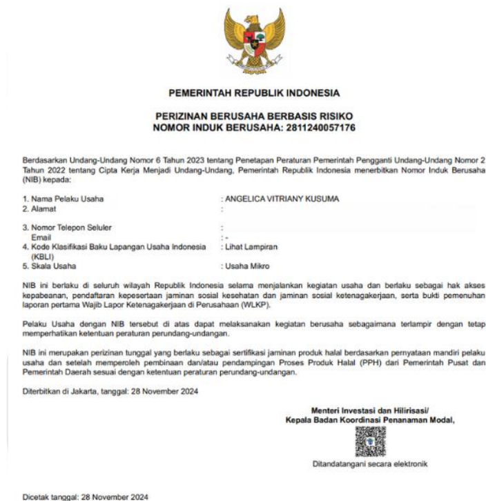
Gambar 2.4 NIB FITNFULL

NIB FITNFULL telah diterbitkan pada bulan November 2024 yang dapat dilihat pada gambar 2.4. Hal tersebut menunjukkan bahwa FITNFULL memiliki kesadaran dan kepatuhan terhadap aspek legalitas usaha, serta berkomitmen untuk menjalankan kegiatan bisnisnya sesuai dengan ketentuan hukum dan peraturan yang berlaku. Selain itu, kepemilikan NIB juga mencerminkan keseriusan FITNFULL dalam membangun fondasi usaha yang profesional dan kredibel di mata konsumen maupun mitra bisnis.