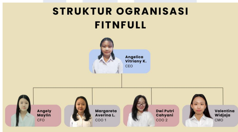
Gambar 2.1 Struktur Organisasi FITNFULL

penentuan prioritas berdasarkan kebutuhan bisnis juga menjadi aspek penting, yakni fungsi inti seperti produksi, pengawasan kualitas, dan distribusi harus diposisikan sebagai fokus utama bisnis. Garis koordinasi dan alur pelaporan harus ditetapkan dengan jelas sehingga setiap anggota memahami ruang lingkup tugas, pihak yang harus dihubungi, serta mekanisme pengambilan keputusan yang membuat proses usaha menjadi efektif. Pendekatan tersebut memungkinkan struktur organisasi FITNFULL tetap efisien, adaptif, dan mampu mendukung pencapaian tujuan perusahaan meskipun dijalankan oleh tim dengan jumlah anggota yang terbatas.