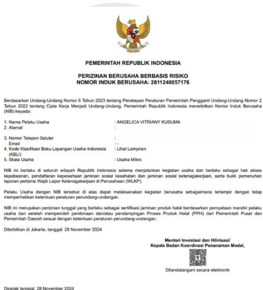
Gambar 2. 4 NIB FITNFULL

usaha, serta berkomitmen untuk menjalankan kegiatan bisnisnya sesuai dengan ketentuan hukum dan peraturan yang berlaku. Selain itu, kepemilikan NIB juga mencerminkan keseriusan FITNFULL dalam membangun fondasi usaha yang profesional dan kredibel di mata konsumen maupun mitra bisnis.