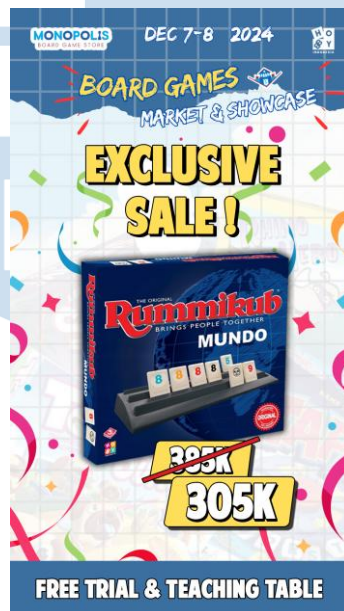
Gambar 2.4 Desain Story Instagram Event

Hobby Indonesia adalah distributor board game yang menyuplai dan mengimpor berbagai jenis board game dari luar negeri ke dalam market board game di Indonesia. Hobby Indonesia juga dipercaya untuk menyuplai banyak board game ke berbagai kafe, khususnya kafe dengan konsep board game. Berdiri sejak tahun 2016, Hobby Indonesia telah berkembang menjadi salah satu supplier terdepan sekaligus publisher board game di Indonesia. Hingga saat ini, mereka telah memiliki ratusan partner di berbagai macam pulau di Indonesia yang pastinya sudah mempercayakan kebutuhan board game kepada mereka.