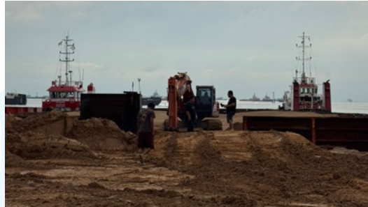
Gambar 2. 5 Dokumentasi Lapangan Proyek Smelter Aluminium

berskala nasional ini menjadi bukti nyata komitmen perusahaan dalam mendukung pertumbuhan industri dan infrastruktur di Indonesia.