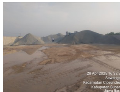
Gambar 2. 6 Dokumentasi Lapangan Proyek Pabrik BYD

PT Hariman Sukses Sejahtera juga tengah terlibat dalam proyek kerja sama dengan perusahaan otomotif BYD dalam pembangunan pabrik baru. Dalam proyek ini, PT HSS kembali bekerja sama dengan China West untuk penyediaan material pasir dan batu yang digunakan dalam proses konstruksi (PT Hariman Sukses Sejahtera, n.d.). Keterlibatan perusahaan dalam proyek BYD menunjukkan kemampuan PT HSS untuk beradaptasi dengan kebutuhan industri modern serta memperluas jaringan kemitraan di tingkat internasional.