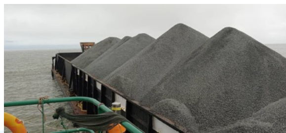
Gambar 2. 4 Dokumentasi Lapangan Proyek Kereta Cepat

Kerja sama ini mencakup kebutuhan pembangunan infrastruktur industri yang memerlukan pasokan material dalam jumlah besar dan berkualitas tinggi. Melalui kolaborasi ini, PT HSS berhasil menunjukkan kapabilitasnya sebagai pemasok material yang mampu memenuhi standar internasional dan menjaga keandalan pasokan secara konsisten (Vivian, 2025).