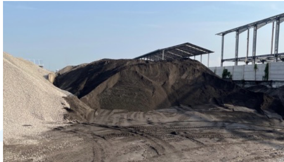
Gambar 2. 3 Dokumentasi Lapangan Proyek Kendal Industrial Park