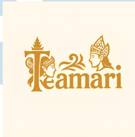
Gambar 3.1 Design Logo Teamari

Visual utama logo Teamari berpusat pada elemen tipografi huruf kapital "T" yang dirancang dengan siluet artistik menyerupai sebuah gapura tradisional. Bentuk gapura ini bukan sekadar estetika, melainkan simbolisasi dari sebuah "gerbang pembuka" menuju pengalaman baru dalam menikmati teh. Gapura ini mengundang konsumen untuk meninggalkan kebiasaan konsumsi kafein yang berlebihan dan memasuki era baru menikmati artisan tea yang menyehatkan. Struktur yang kokoh namun artistik ini sekaligus menegaskan identitas brand yang berakar kuat