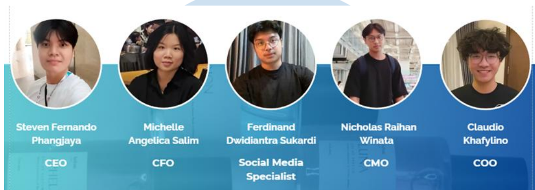
Gambar 2. 1 Struktur Organisasi SoYou

Berisi pembagian tugas masing-masing anggota kelompok dan deskripsi tugas serta kewajiban dari penulis. CEO secara umum bertugas melakukan koordinasi antar anggota kelompok dan menyiapkan kelompok untuk kegiatan-kegiatan tertentu termasuk mencari pendanaan.