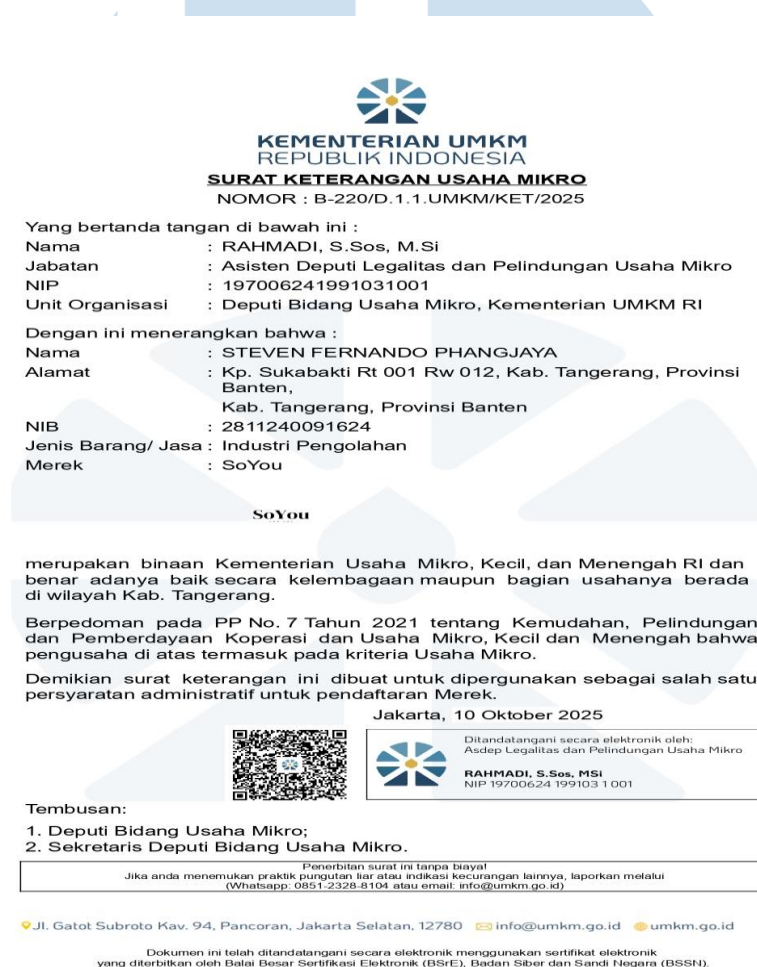
Gambar 2. 4 Surat Keterangan Usaha Mikro