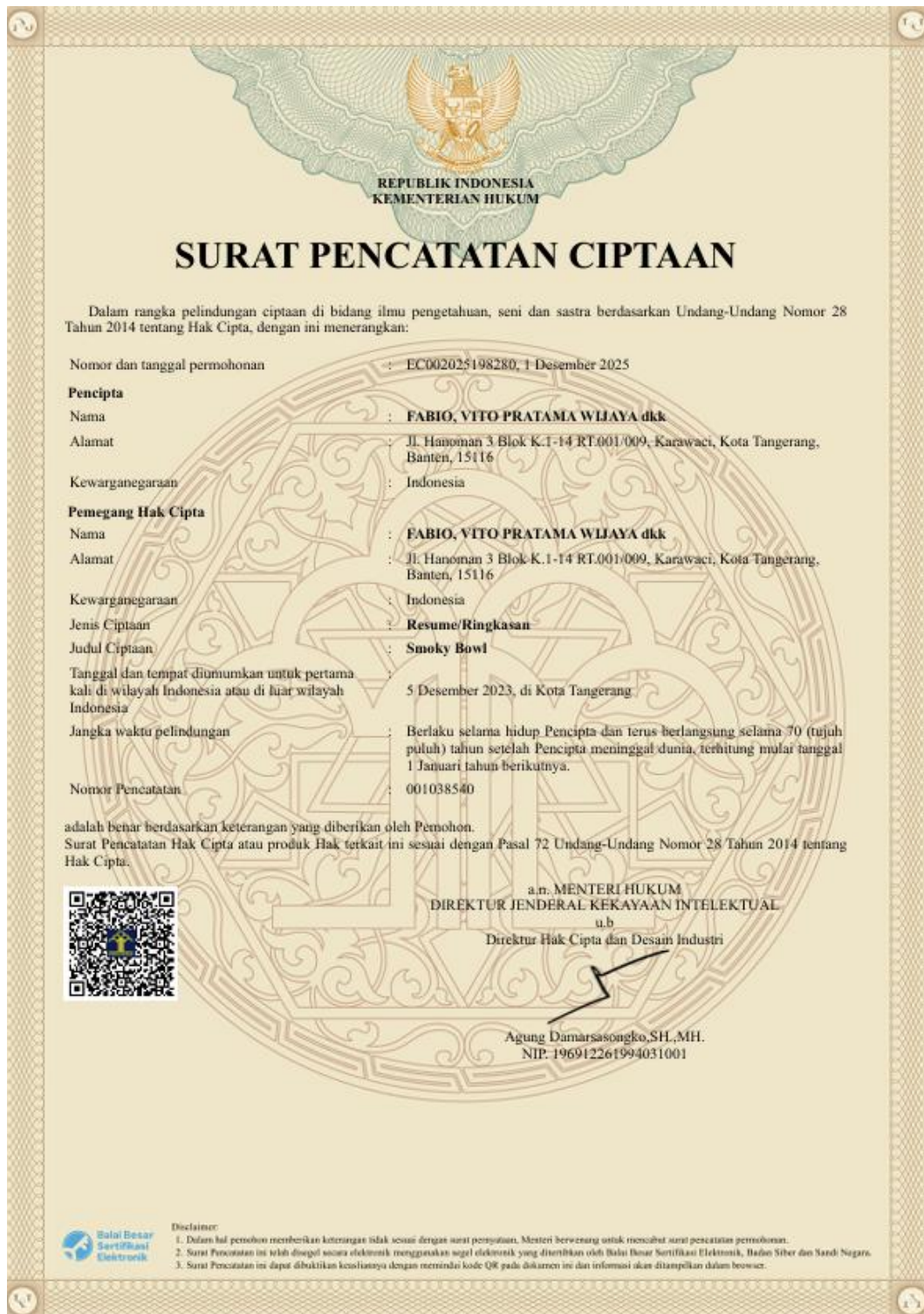
Gambar 2.4 HKI SmokyBowl