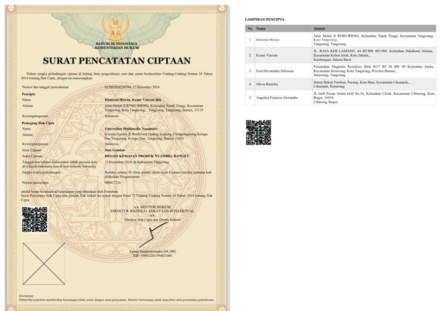
Gambar 2. 5 Surat Pencatatan Hak Cipta Design Nyambel Banget

Hak cipta desain adalah hak perlindungan hukum yang diberikan kepada pencipta atas karya desain visual atau bentuk tampilan suatu produk. Perlindungan ini menjamin bahwa hasil karya tersebut tidak boleh digunakan, digandakan, atau dimodifikasi oleh pihak lain tanpa izin dari pemiliknya. Hak cipta tersebut berlaku selama 50 tahun sejak pertama kali diumumkan dan memberikan perlindungan penuh terhadap unsur kreatif yang terdapat pada kemasan produk. Dengan adanya sertifikat ini, desain kemasan Nyambel Banget diakui sebagai karya orisinal dan terlindungi oleh undang-undang, sesuai dengan UU Nomor 28 Tahun 2014 tentang Hak Cipta. Hal ini menjadi bukti bahwa produk Nyambel Banget tidak hanya berfokus pada kualitas rasa, tetapi juga menjaga orisinalitas dan identitas visualnya secara sah, sehingga memperkuat nilai merek serta kepercayaan konsumen terhadap produk.