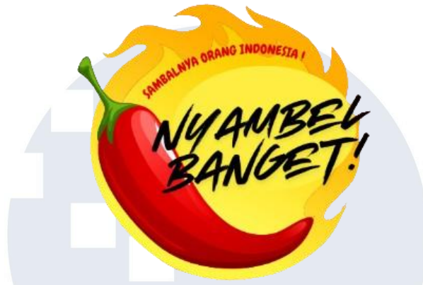
Gambar 2. 1 Logo Nyambel Banget

Badan usaha merupakan suatu kesatuan yuridis, teknis, dan ekonomis yang bertujuan untuk mencari keuntungan atau memberikan layanan kepada masyarakat. Dalam konteks kegiatan kewirausahaan mahasiswa, pemilihan bentuk badan usaha menjadi hal penting karena berpengaruh terhadap aspek legalitas, pembagian tanggung jawab, serta strategi pengelolaan bisnis yang dijalankan.