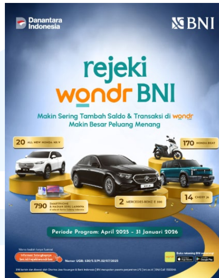
Gambar 2.5 Instagram Post rejekiwondr BNI

meningkatkan engagement untuk dilihat nasabah, BNI membuat desain media digital dan media cetak sebagai materi visual promosi.