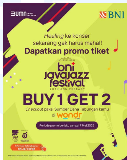
Gambar 2.4 BNI Java Jazz Festival 2025

BNI Java Jazz Festival 2025 merupakan sebuah acara yang diproduksi oleh Java Festival Production dengan tujuan untuk menampilkan dan mempromosikan musik bergenre Jazz dari berbagai musisi secara lokal dan juga internasional, serta BNI berperan penting sebagai sponsor utama yang terlibat dan berkontribusi dalam penyelenggaraan acara. Oleh karena itu, BNI membuat desain untuk meningkatkan minat pengunjung untuk terlibat dan menghadiri event BNI Java Jazz Festival 2025.