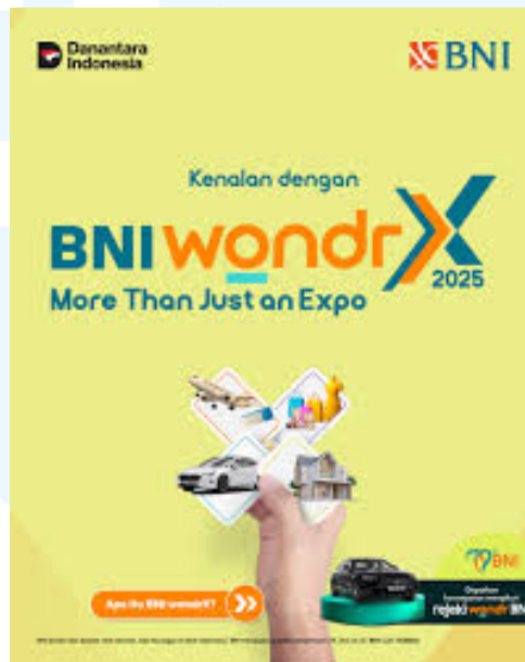
Gambar 2.3 Instagram Post Event BNI wondrX Expo 2025

BNI wondrX Expo 2025 merupakan sebuah event besar yang mengadakan pameran yang inovatif, pelayanan perbankan, serta berbagai macam kolaborasi brand yang bekerjasama dengan BNI untuk para pengguna aplikasi wondr dan pemegang kartu BNI.