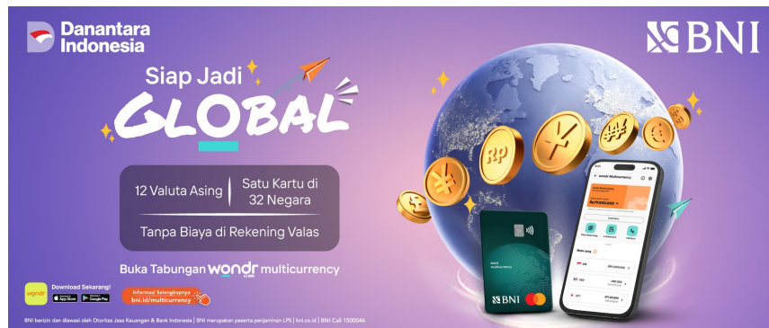
Gambar 2.6 Web Banner wondr Multicurrency

Kini aplikasi wondr multicurrency memiliki 12 valuta asing, serta penggunaan kartu BNI sebagai pembayaran yang dapat digunakan di 32 negara tanpa adanya biaya tambahan.