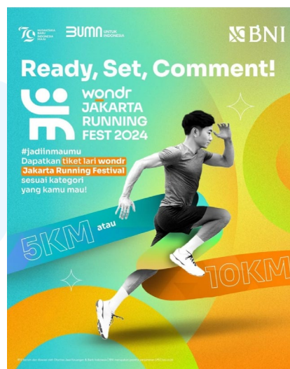
Gambar 2.7 Instagram Post wondr Jakarta Running Festival 2024

Wondr Jakarta Running Fest 2024 merupakan kolaborasi antara BNI dengan Jakarta Running Festival dengan mengadakan acara olahraga, yaitu aktivitas lari yang diselenggarakan pada tanggal 12-13 Oktober 2024.