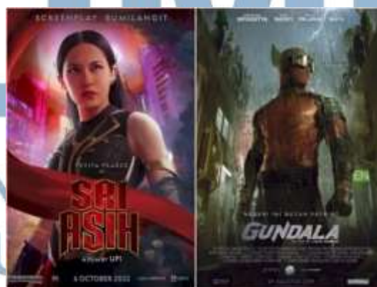
Gambar 2.3 Poster film Sri Asih

Pada tahun 2019, Bumilangit Entertainment memperkenalkan Jagat Sinema Bumilangit, sebuah semesta sinematik yang memadukan elemen dari karya klasik dan pembaruan yang bersifat kontemporer. Semesta ini dirancang sebagai waralaba yang berfokus pada adaptasi film superhero berbasis karakter-karakter klasik Indonesia, yang sebelumnya telah diterbitkan dalam komik-komik Bumilangit (Satyagraha, 2021).