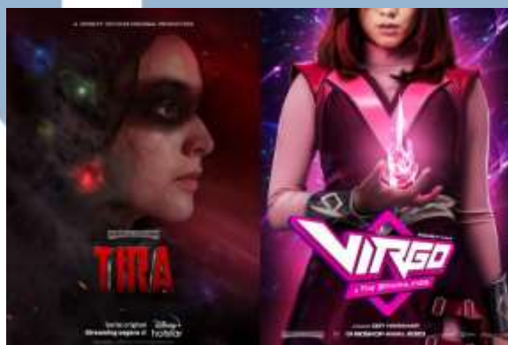
Gambar 2.4 Poster film Virgo and The Sparklings dan Tira

Film Gundala karya Joko Anwar menjadi produksi perdana dalam Jagat Sinema Bumilangit. Menurut Herfianto (2020), film ini berhasil menembus Festival Film Toronto 2019 pada kategori Midnight Madness , Paris International Fantastic Film Festival (PIFFF), serta memperoleh sembilan nominasi di Festival Film Indonesia 2019. Film kedua, Sri Asih menghadirkan karakter superhero wanita pertama yang diangkat ke layar lebar dalam Jagat Sinema Bumilangit. Karya ini juga memperoleh penghargaan di Fantastic Fest 2023, sebuah pencapaian yang disambut dengan penuh oleh kegembiraan oleh sutradara-nya, Upi. Ia menyampaikan bahwa penghargaan tersebut dapat menjadi pemantik semangat untuk terus berkarya dan menghadirkan cerita baru di masa mendatang (Febriari, 2023).