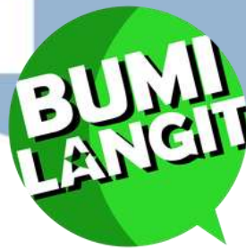
Gambar 2.1 Logo PT Bumilangit Entertainment

Menurut Bumilangit Entertainment (2025), Bumilangit adalah sebuah keluarga bagi para seniman orisinal yang telah berkarya sejak tahun-tahun awal hingga saat ini, serta para penggemar setia yang mengapresiasi karya-karya kami yang luar biasa. perusahaan ini merupakan perusahaan hiburan berbasis karakter terkemuka di Asia yang mengelola perpustakaan tak tertandingi dengan lebih dari 1.200 karakter yang ditampilkan dalam komik yang diterbitkan dalam enam puluh tahun terakhir. Kekuatan karakter tersebut tidak hanya berdasarkan popularitas mereka, tetapi juga kekayaan cerita di balik setiap karakter.