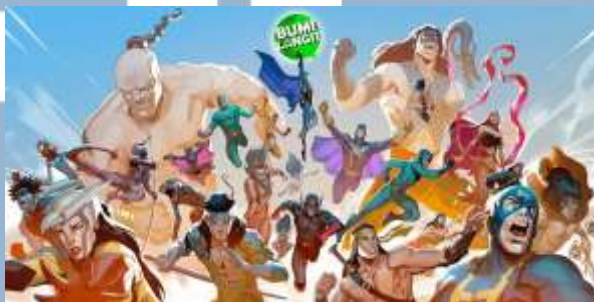
Gambar 2.2 Kumpulan Karakter Bumilangit