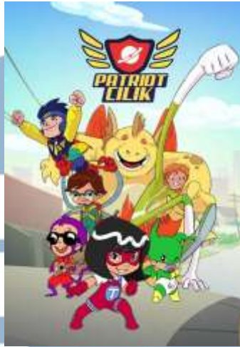
Gambar 2.5 Serial animasi Patriot Cilik